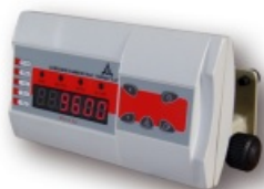
Miernik ZOT-3.4 (w obudowie z tworzywa IP-40)